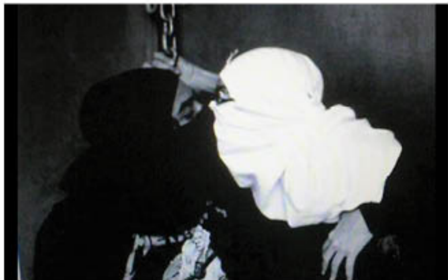
MICHELLE R.O. (Puerto Rico) Material Recuperado / Recovered Image , 2012 Video projection on DVD, 16:05 minutes (Still Image from video)